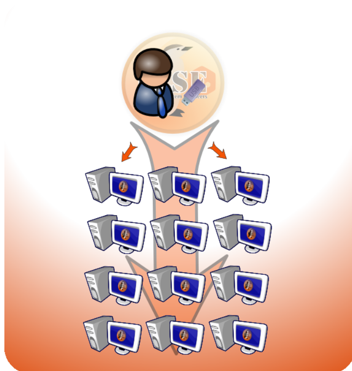
FIG. 2.2 – Schéma d'utilisation pour un professeur