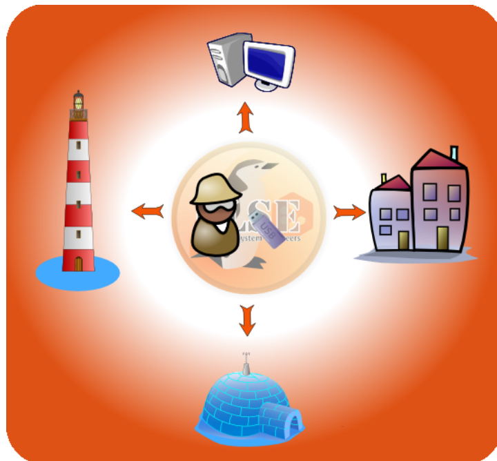
FIG. 2.1 – Schéma d'utilisation pour un étudiant